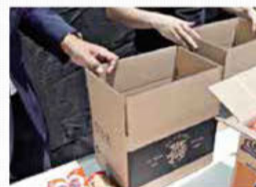
EL 'SELLO'. Algunas cajas con enseres llevan la marca 'El Chapo'.