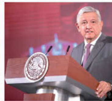
EN MAYO. Promete AMLO entregar recursos para reactivar la economía.