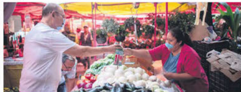
NO QUEDA DE OTRA. Comerciantes de la CDMX buscan 'el pan de cada día'.