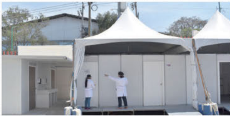
CARPAS SANITARIAS. Instalan 7 hospitales en CDMX para ampliar capacidad.

— V. Chávez / M. Guardiola / PÁGS. 28 Y 29