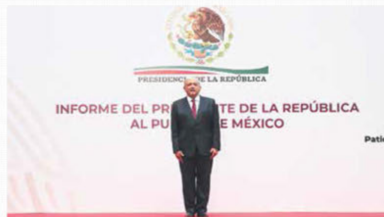
SEROMPIÓ EL MOLDE. Dijo que no aplicará medidas que fomenten corrupción.