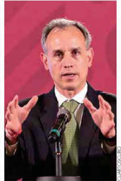
LÓPEZ-GATELL. El paciente 'número 1' saldría hoy del INER.

Y para México estima sólo un avance de 0.7 por ciento, a diferencia de 1.2 por ciento proyectado en noviembre. — Z. Flores / L. Hernández / PÁGS. 4, 9, 14, 25 Y 32