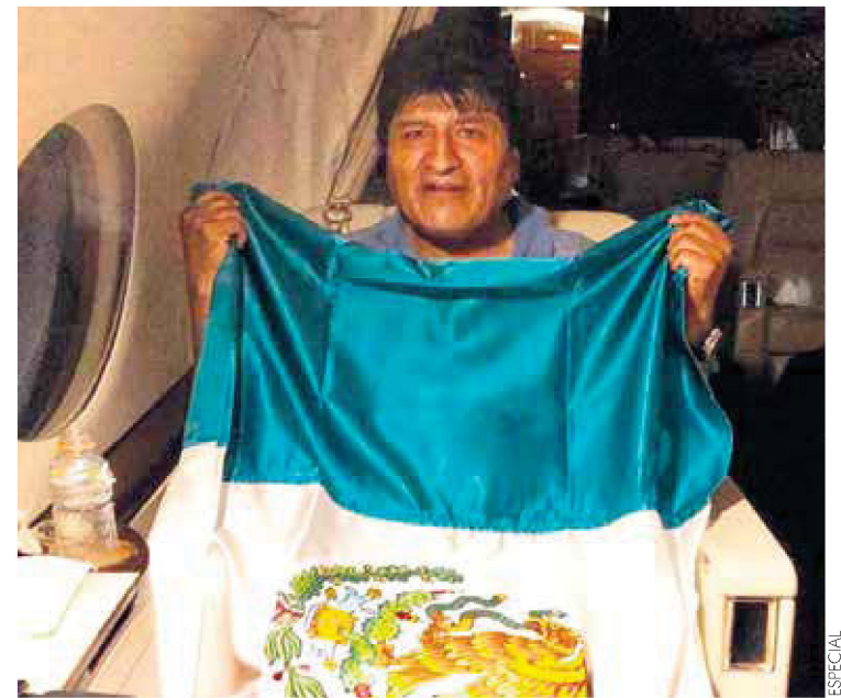
SIN ESCALAS. Envía México por Evo para asegurar un traslado sin contratiempos.

SE LE ADELANTA 3 DÍAS AL BUEN FIN CON EL 'FIN IRRESISTIBLE'. PÁG. 20