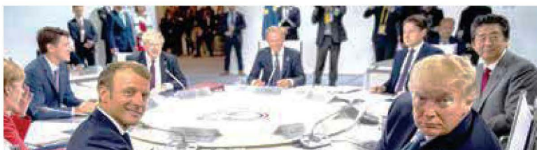
MACRON LO INVITA. Canciller de Irán visitó la reunión del G-7 ante sorpresa de Trump.

global. En la apertura de hoy, el peso inició la jornada presionado en 20.10 unidades por dólar. — J. Valdelamar / E. Rodríguez / PÁGS. 15, 16 Y 30