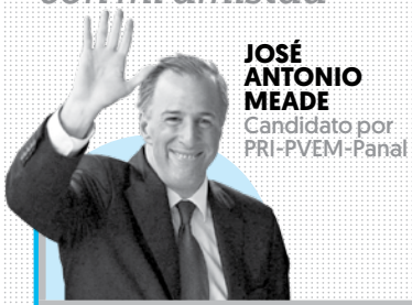
JOSÉ ANTONIO MEADE Candidato por PRI-PVEM-Panal

“Mi mayor respeto y admiración... siempre contará con mi amistad”