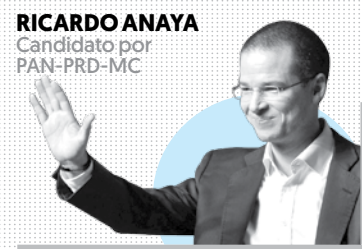
RICARDO ANAYA Candidato por PAN-PRD-MC

“Sus aportaciones al país y a esta contienda, han sido muy valiosas”