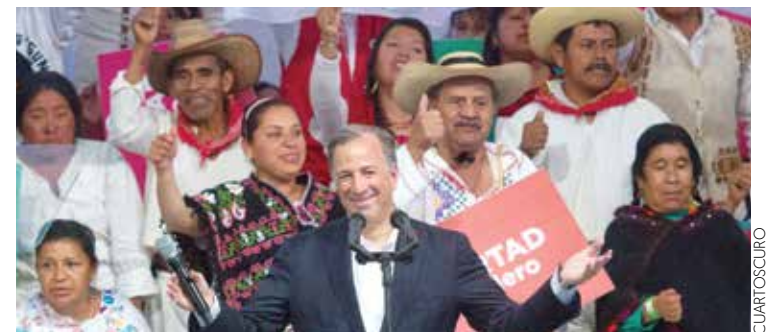
89 ANIVERSARIO DEL PRI. El candidato presidencial fue orador único.