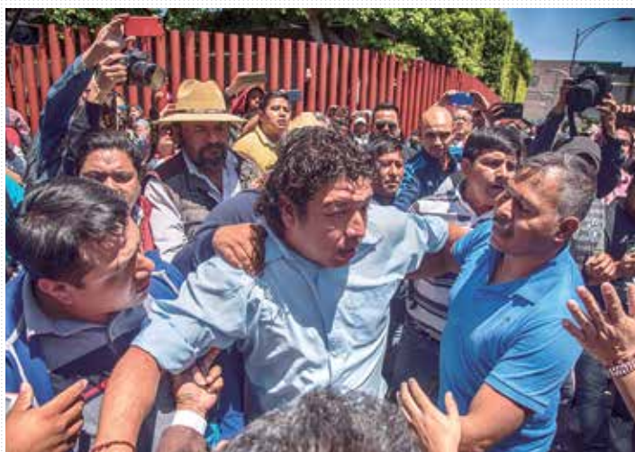
TOMA. Integrantes de la CNTE cerraron por 4 horas el acceso al recinto.

Ante la falta de condiciones, los partidos pidieron a la Mesa Directiva aplazar la sesión de hoy para el 2 de abril. — Víctor Chávez