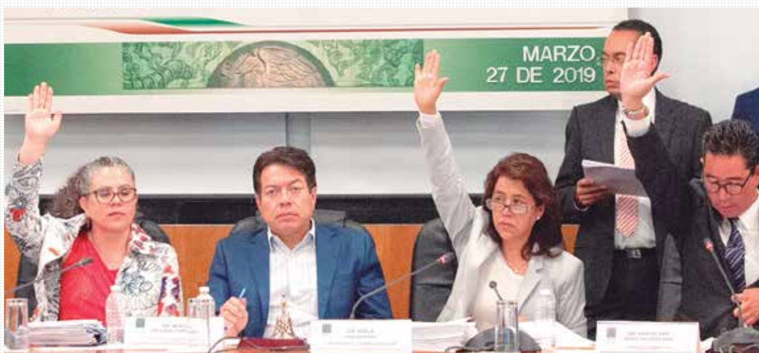
VOTO. Dicen diputados que en esta ocasión las cosas se hicieron diferentes, con pluralidad, esfuerzo y participación.