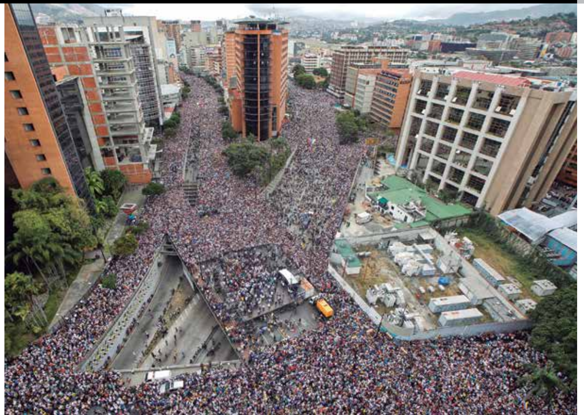
"Y VAA CAER, Y VAA CAER". Miles de venezolanos salieron desde muy temprano con ese grito a las calles de Caracas.