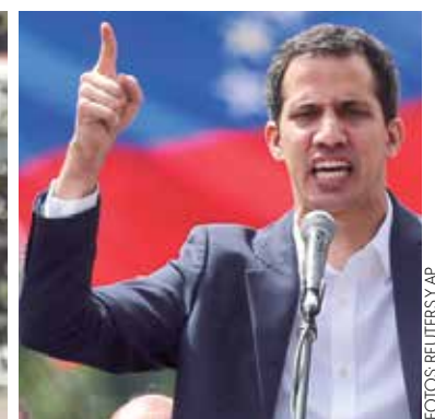
GUAIODÓ. Se autoproclama interino.