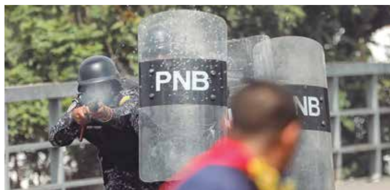
REPRESIÓN. Reportan que durante las protestas al menos murieron 16 personas.