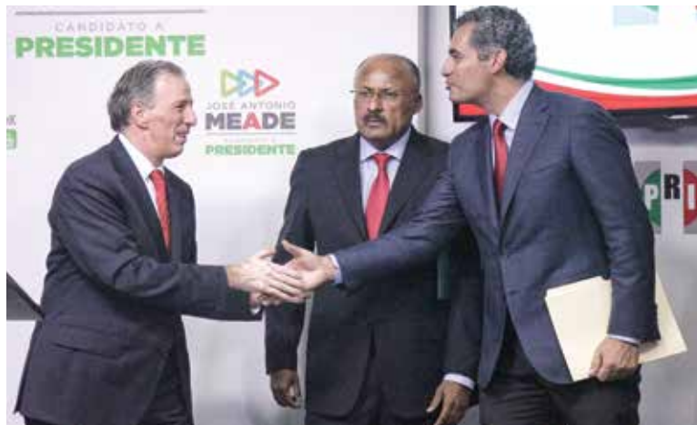
RELEVO. El candidato presidencial con los dirigentes entrante y saliente del PRI.

► SHANNON K. O'NEIL ¡El PRI ha muerto, larga vida al PRI! / PÁG. 12