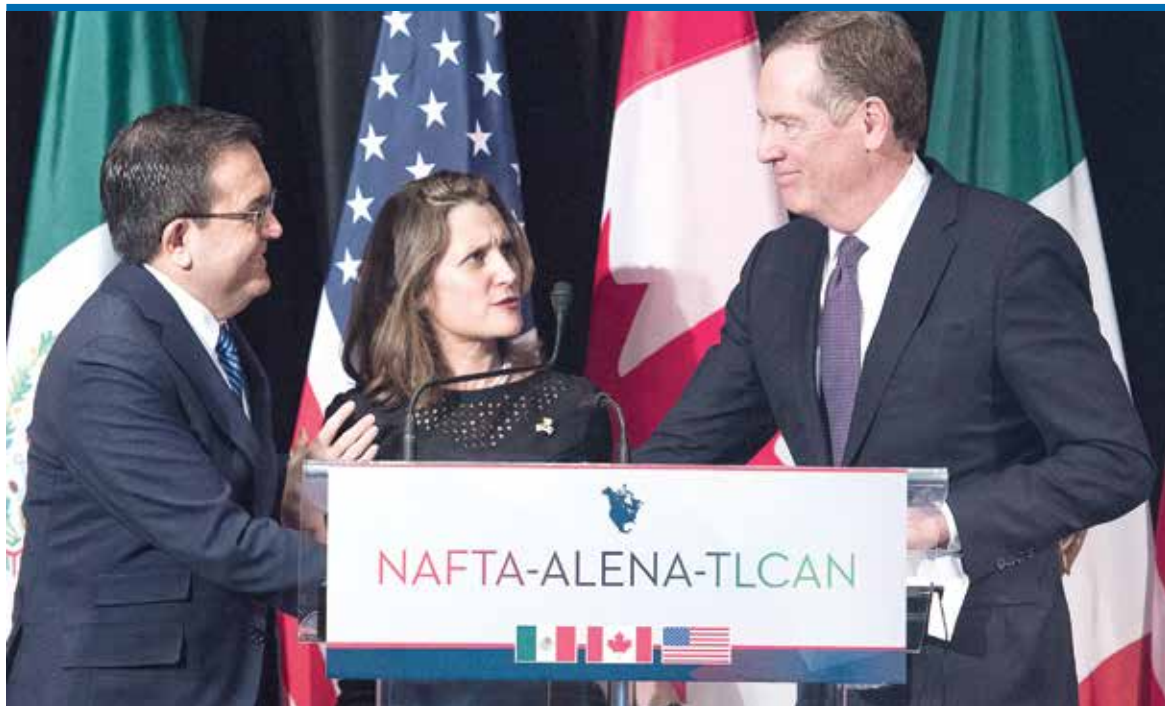
EN CDMX, PRÓXIMA CITA. México, Canadá y EU lograron cerrar ya tres capítulos: Pymes, competencia y anticorrupción.