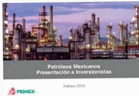
PEMEX. Este es el documento entregado a inversionistas.