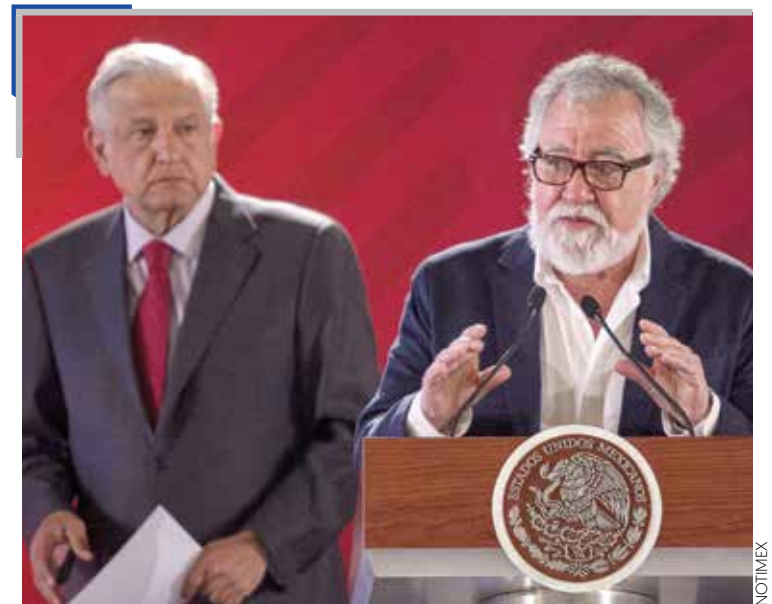
SALDO. La guerra contra el crimen ha dejado un millón de víctimas, dijo AMLO.