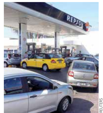
JALISCO. Registran gasolineras largas filas y compras de pánico por escasez.

En la primera semana de 2019, las gasolinas Magna y Premium bajaron respecto a un mes antes, diciembre de 2018, entre 7 y hasta 20 centavos, según la plataforma de consulta PetrolIntelligence. De los estados que estudia, el único donde subió según la firma fue Guanajuato, por la escasez. — Daniela Loredó / Héctor Usla / PÁG. 5