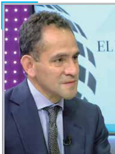
EL FINANCIERO BLOOMBERG

PRESUPUESTO. Descarta Herrera que se vaya a pecar de optimismo