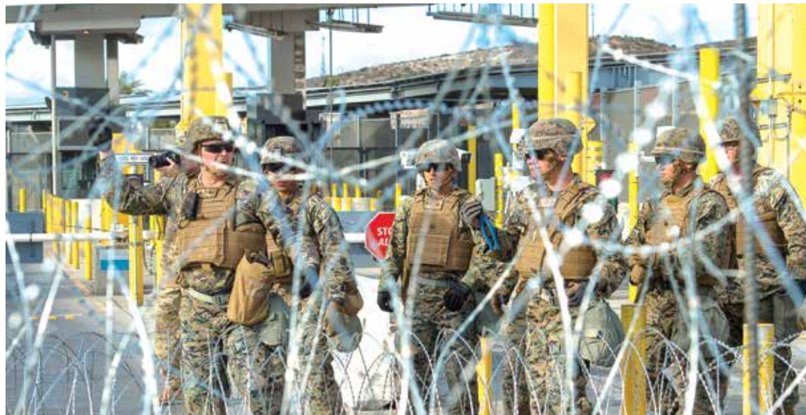
'MURO'. En la garita de San Ysidro, la Guardia Nacional y agentes fronterizos de EU realizaron ayer un operativo de prueba.