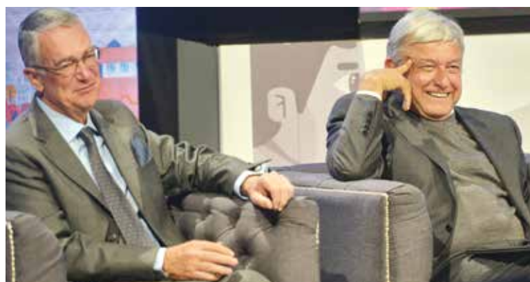
ACUERDOS. AMLO dijo ante Ricardo Salinas que sí quiere alianzas con empresarios.

Andrés Manuel López Obrador aseguró ayer que sin oposición y sin cuestionamientos, "no se hallaría".