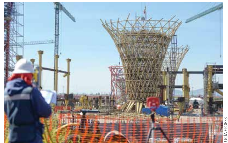
CONTINÚAN. La cancelación sería a finales de mes; costo ascenderá a 120 mil mdp.

“Tenemos contratos con las empresas constructoras y no hemos recibido ninguna instrucción de cancelarlos, en consecuencia, tenemos que respetarlos (...)”, aseguró.