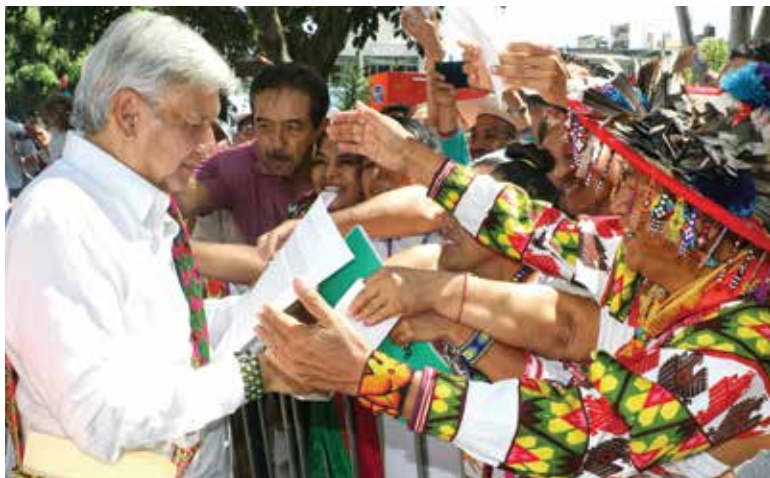
AMLO. Desde ayer y hasta que tome posesión hará gira de agradecimiento.

SISMOS SE TRIPLICA COSTO DE SEGUROS PARA CASAS; COMPRAN MÁS VIVIENDA. PÁGS. 10 Y 30