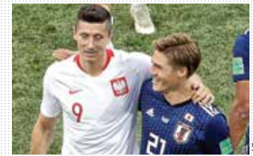
'AUTOGOL' DE JAPÓN LOGRÓ SU PASE GRACIAS AL FAIR PLAY, PERO 'NEGOCIÓ' EL RESULTADO CON POLONIA. PÁGS. 27, 28 Y 29

Del sábado al martes se jugarán los partidos entre las 16 selecciones que siguen en el sueño mundialista