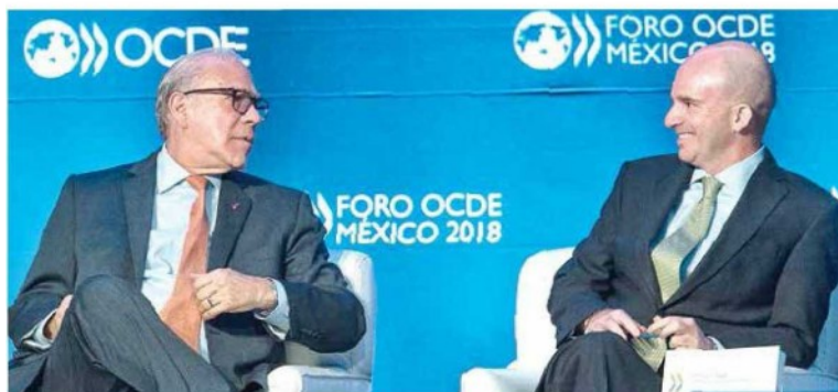
REFORMADORES. Al Foro OCDE México 2018 asistió el secretario de Hacienda, José Antonio González Anaya.