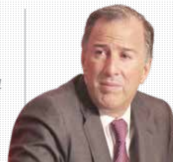
ANDRÉS MANUEL LÓPEZ Candidato de Morena-PES-PT

"...Si pensamos que el presidente hace la procuración de justicia, no vamos a avanzar..."