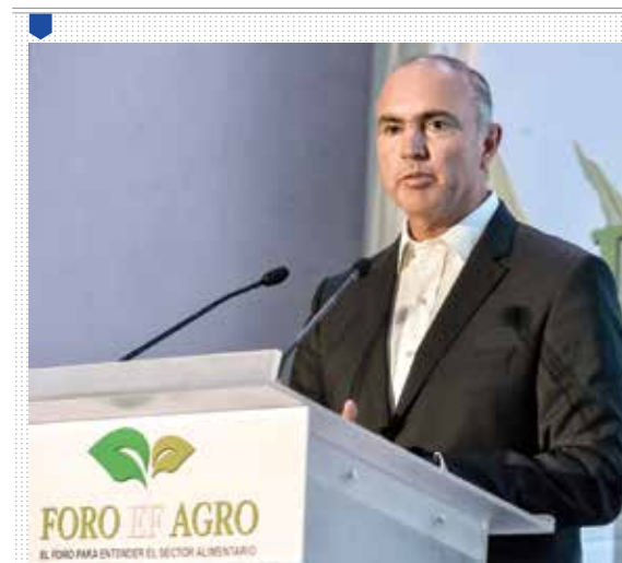
CALZADA ROVIROSA AUN SIN TLCAN, EL SECTOR AGRO EN MÉXICO CRECERÍA: SAGARPA. PÁG. 4