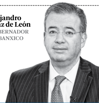
Alejandro Díaz de León GOBERNADOR DE BANXICO

“...tasas en EU, política fiscal en EU, renegociación del TLCAN, tres factores que han incidido en el peso...”