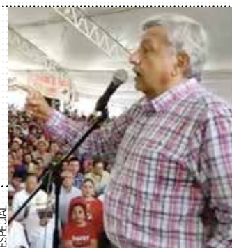
José Antonio Meade PRECANDIDATO POR PRI-PVEM-PANAL

“Vamos hacer un acuerdo con maestros, padres de familia, para llevar a cabo una auténtica reforma”