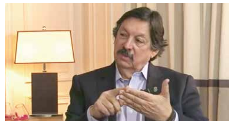
POLÉMICA. Mineros disidentes piden a Gómez Urrutia aclarar dónde está el dinero.