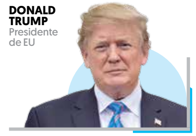
DONALD TRUMP Presidente de EU

ANAYA MÉXICO DEBE DENUNCIAR EN INSTANCIAS INTERNACIONALES. PÁG. 48