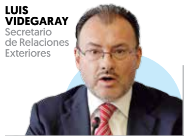
LUIS VIDEGARAY Secretario de Relaciones Exteriores

"EU no será un campo de inmigrantes... ni complejo para mantener refugiados"