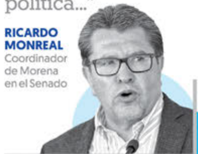
RICARDO MONREAL Coordinador de Morena en el Senado

"No hay ninguna iniciativa del tema, vamos a actuar con responsabilidad política..."