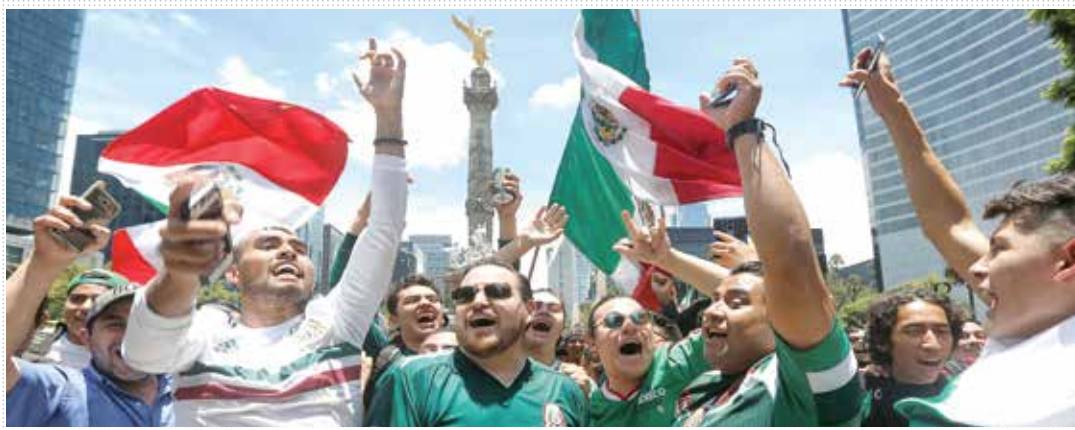
AFICIÓN. El Ángel y el Zócalo en la CDMX fueron los lugares donde los fanáticos fueron a celebrar.

EN ECONOMÍA, MERCADOS Y NEGOCIOS ALIANZA CON Bloomberg