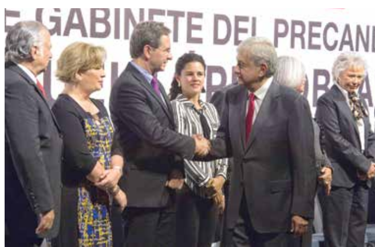
EQUIPO. El precandidato presentó a 8 hombres y 8 mujeres que le acompañarán.