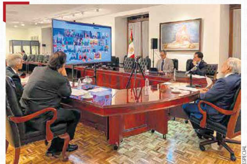
CUMBRE DEL G20. En reunión virtual con miembros de este grupo, el presidente AMLO pidió a la ONU garantizar el acceso de medicamentos y equipo. / PÁG. 41

Tedros Adhanom, de la OMS, reprochó a líderes mundiales por las muertes y la devastación económica. — Redacción / PÁG. 34