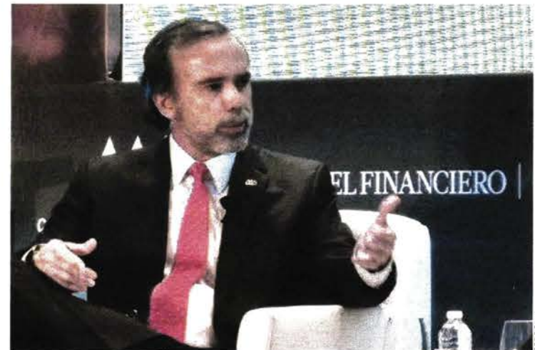
RIESGO. El país y la 4T tienen 5 o 6 meses para demostrar que hay mejoría.