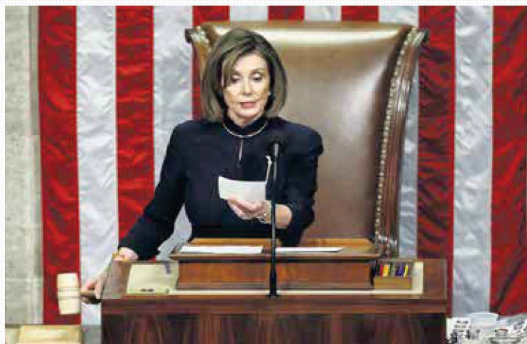
IMPEACHMENT. Nancy Pelosi aseguró que el mandatario republicano no les dejó otra opción; Trump afirmó que los demócratas están consumidos por el odio.

EN ECONOMÍA, MERCADOS Y NEGOCIOS ALIANZA CON Bloomberg