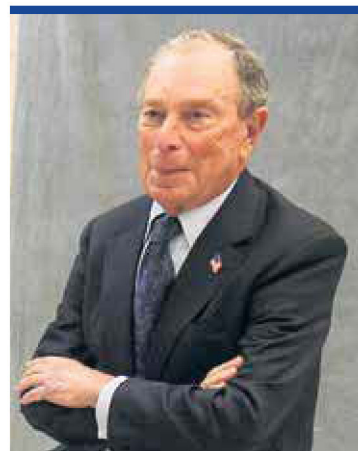
LISTO. Bloomberg asegura que EU no aguanta 4 años más de imprudencias.

En tanto, organismos autónomos como el INE y el INAI tuvieron recortes. El primero, de mil 75 millones de pesos, y el INAI de casi 23 millones.—R. Rueda / PÁG. 42