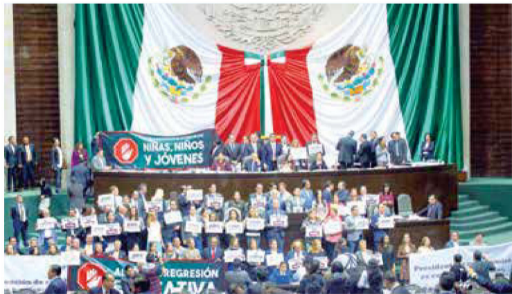
TRIBUNA. La discusión de las leyes educativas se prolongó hasta la madrugada.