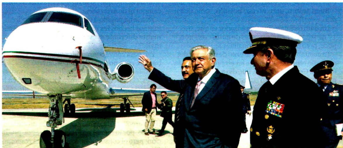
CAMBIARÁ DE NOMBRE. El nuevo aeropuerto se llamará "Felipe Ángeles" y la pista "Salinas Carranza", dijo AMLO.