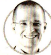
RICARDO ANAYA Frente (PAN-PRD-MC)