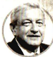
ANDRÉS MANUEL LÓPEZ OBRADOR Morena-PT