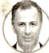
JOSÉ ANTONIO MEADE PRI-PVEM-Panal