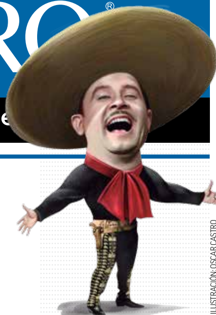
ILUSTRACIÓN: OSCAR CASTRO