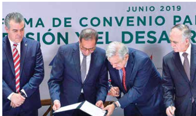
IP Y GOBIERNO. Acuerdan fomentar la inversión y el desarrollo incluyente.