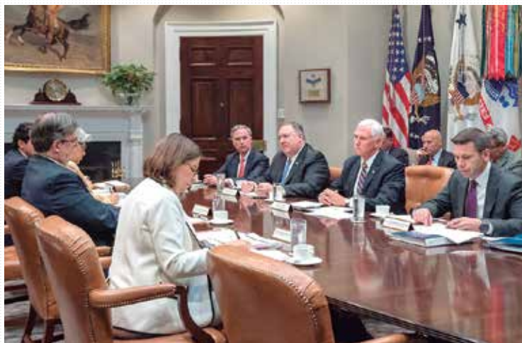
WASHINGTON. Equipos de México y EU se reunieron a dialogar; hoy continúan.