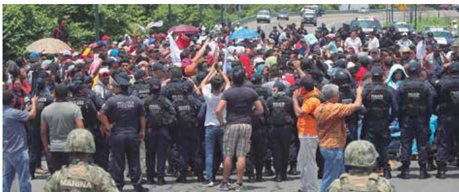
DETENIDOS. Más de 500 migrantes fueron contenidos ayer en un operativo donde participaron, por primera vez, elementos de la Guardia Nacional y otras fuerzas.