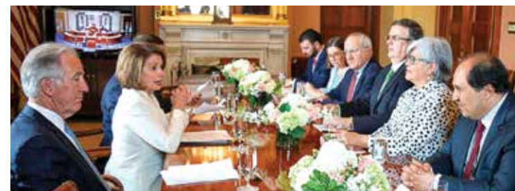
CABILDEO. El equipo mexicano se reunió en Washington con Nancy Pelosi, líder de la mayoría demócrata en la Cámara de Representantes. PÁG. 34

Márquez, titular de Economía; Víctor Villalobos, secretario de Agricultura, y Lázaro Cárdenas, asesor de la Presidencia. Por EU estarán Mike Pence, vicepresidente; Mike Pompeo, secretario de Estado, y Kevin McAleenan, secretario interino de Seguridad Nacional. — Redacción / PÁGS. 7Y 35