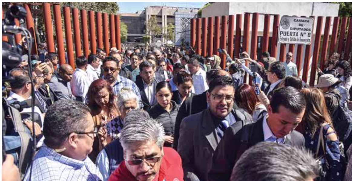
CÁMARA DE DIPUTADOS. Trabajadores de San Lázaro, periodistas y legisladores fueron desalojados ante bloqueos de la CNTE.

REPITE AMLO PROPUESTAS PARA CUATRO COMISIONADOS DE LA CRE. PÁG. 8