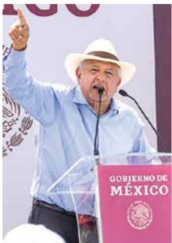
DEGIRA. Hoy la conferencia mañanera del presidente es en Tijuana.

La relación bilateral entre México y España no está en riesgo, afirmó el presidente Andrés Manuel López Obrador. El mandatario defendió ayer su decisión de pedir que la Corona española ofrezca una disculpa por los agravios cometidos en la conquista hace casi 500 años. En tanto, el Vaticano informó que el Papa ya pidió perdón por la conquista de América. — M. León NACIONAL / PÁG. 50