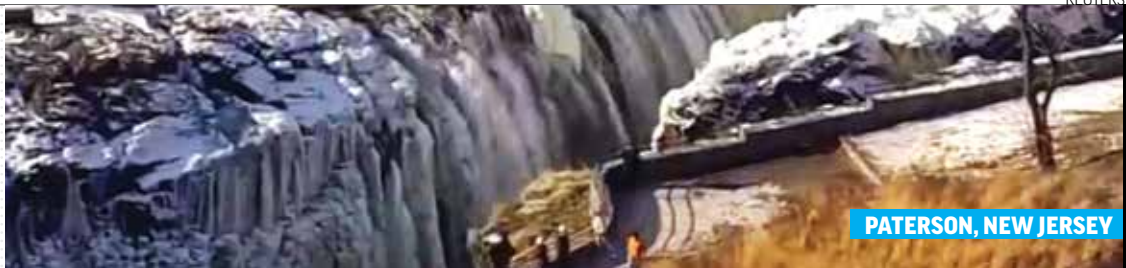
PATERSON, NEW JERSEY

CENTRO DE EU, AFECTADO; EN MÉXICO, EL NORTE SUFRE BAJAS TEMPERATURAS. PÁG. 25