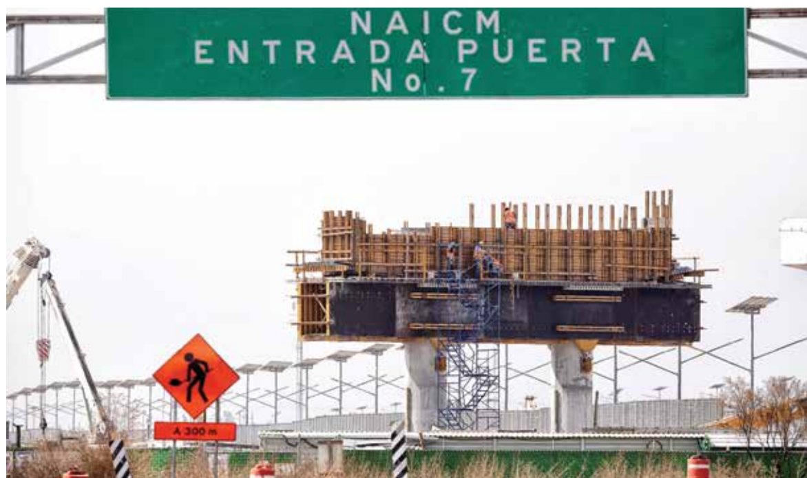
PENDIENTES. En breve el gobierno se reunirá con los tenedores de la Fibra E para negociar pago anticipado.