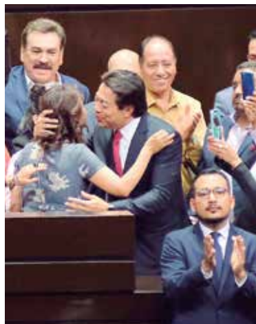
TRIBUNA. Celebra Morena con aliados.

Sin varios de los cambios propuestos por la SEP y la CNTE en la agenda, los grupos parlamentarios reiniciaron el debate a las 20:30 horas, luego de que a las 5 de la tarde fijaran un receso de media hora, que duró más de tres horas. La sesión se realizó sin manifes-