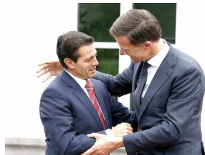
VISITA OFICIAL. El presidente Peña Nieto se reunió en La Haya con Mark Rutte, primer ministro holandés.