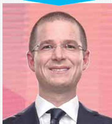
JOSÉ ANTONIO MEADE Candidato de PRI-PVEM-Panal

“...Te pregunto (Meade): ¿tu jefe EPN ha operado con honestidad?, sí o no”