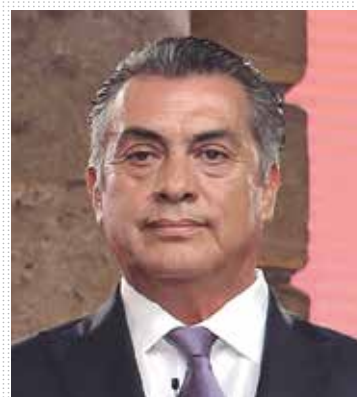
ANDRÉS MANUEL LÓPEZ Candidato de Morena-PES-PT

“No es montón Andrés, es que dices cada barbaridad”