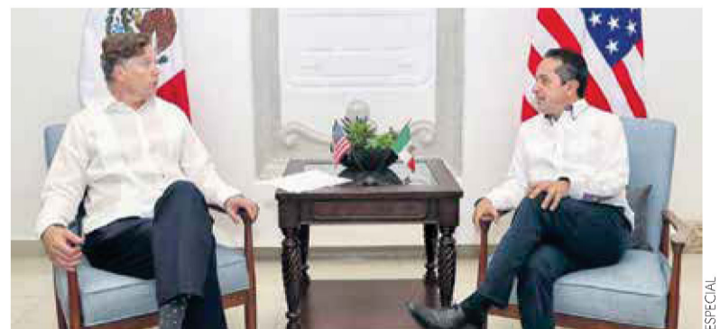
CUMBRE. El embajador de EU se reunió con Carlos Joaquín, gobernador de Q. Roo.