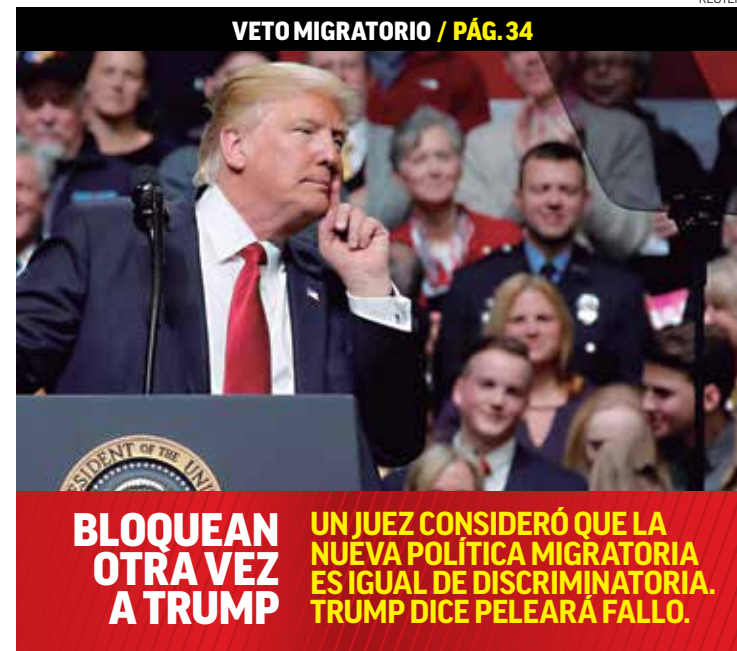
VETO MIGRATORIO / PÁG. 34