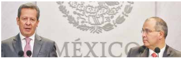
REVELAN. Ubican hasta febrero mil 228 tomas clandestinas en todo el país.

ADMITE CHOFER DE BARREIRO: FUI PRESTANOMBRES EN COMPRA DE NAVE. PÁG. 50